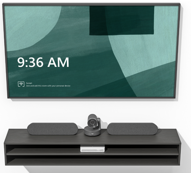
Logitech RoomMate con il sistema Rally Plus