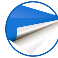
Película adhesiva Adhesive film