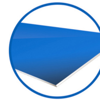
Panel con forma shaped panel